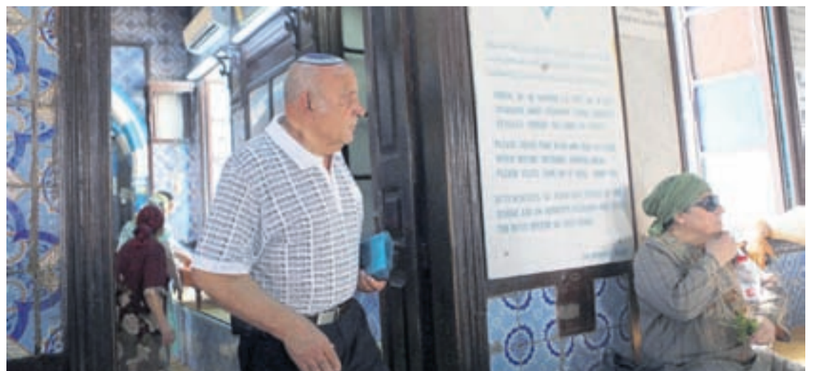
ta kere cu algun lo a cambia nan plan, despues di e atake di dia 18 di maart ultimo, riba Museo Nacional Bardo, cual tabata un atake realisa pa al-Qaida. □